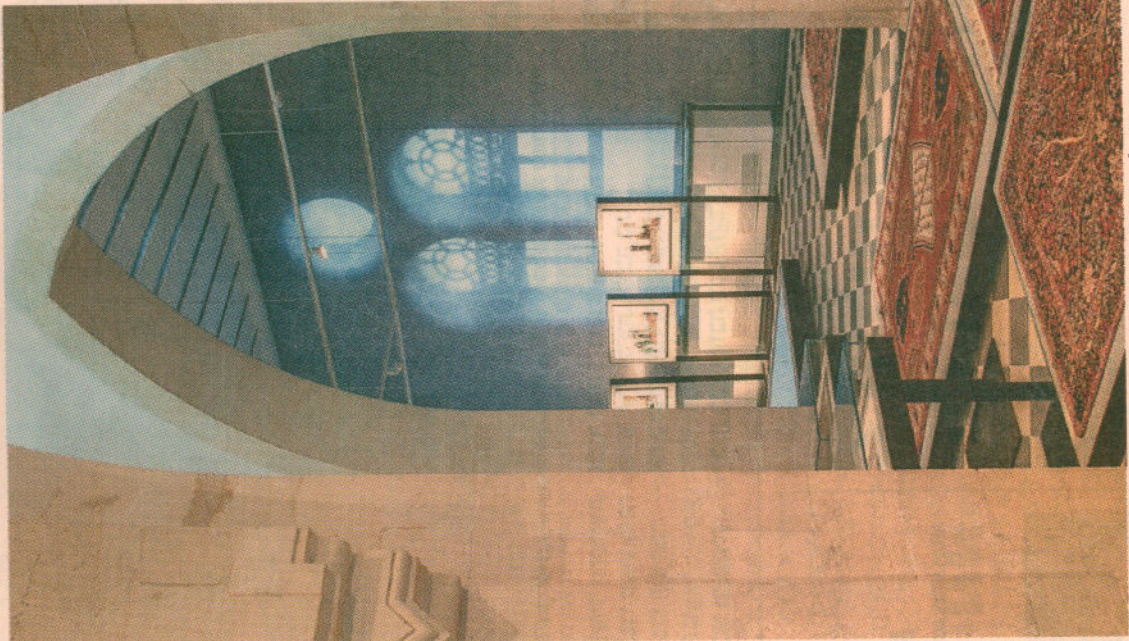
המוזיאון החדש לתרבות האסלאם. מקשרים

המסגד עמד עד לאחריה במוקד מחלוקת משפטית ארוכת שנים. לאחר שגורמים כציבור