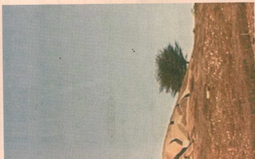
לריחוס והשראה למהפכה